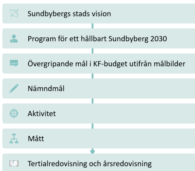
Bild: Principskiss över styrkedja

Bolagens budget upprättas utifrån verksamhetens kända och förväntade förutsättningar, för att genomföra de uppdrag och uppnå de mål och avkastningskrav som ägaren beslutat.